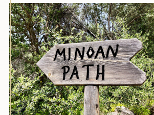
auf den Spuren der Minoer